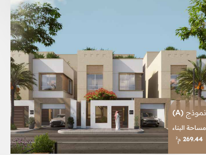
نموذج (A) مساحة البناء 269.44 م 2