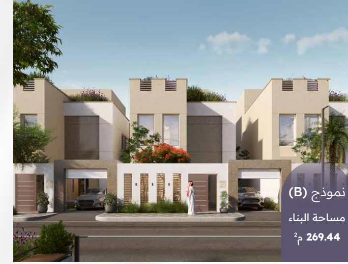
نموذج (B) مساحة البناء 269.44 م 2