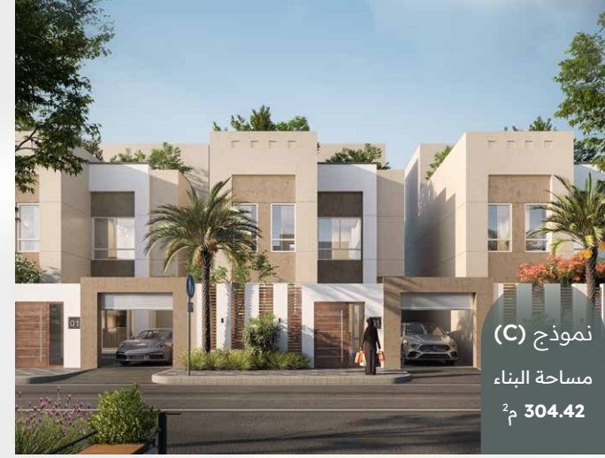
نموذج (C) مساحة البناء 304.42 م 2